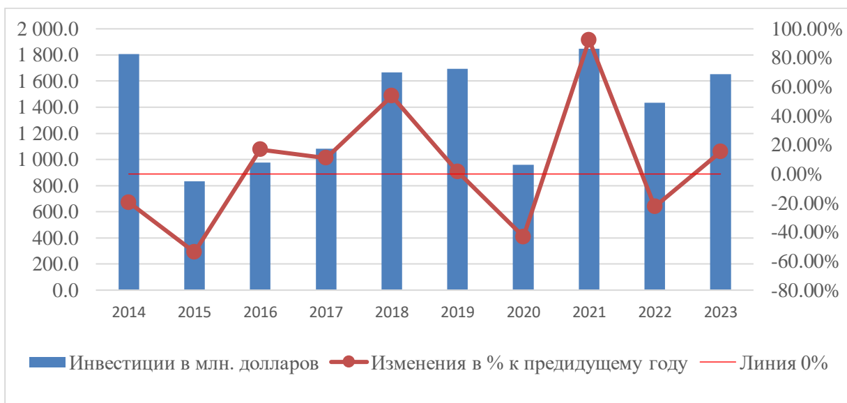
Рисунок 1. Инвестиции, привлеченные РК из КНР 2014 – 2023 год.

Для РК подобное сотрудничество так же открыло множество перспектив. В частности, за счет улучшения отношений между странами, появилась возможность привлекать больше инвестиций, в которых страна крайне нуждается на данном этапе развития (смотри рисунок 1).