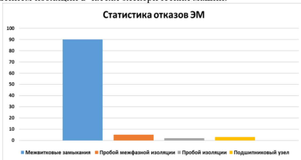
Рисунок 1. Статистика отказов электрических машин

На рисунке 1 представлена статистика отказов, связанных с нарушением изоляции в частях электрических машин.