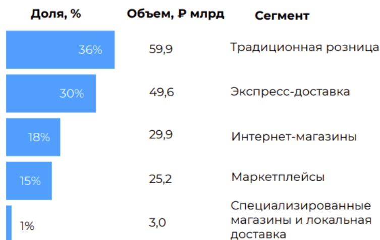
Рисунок 1. Структура рынка онлайн-торговли продуктами питания за 2022