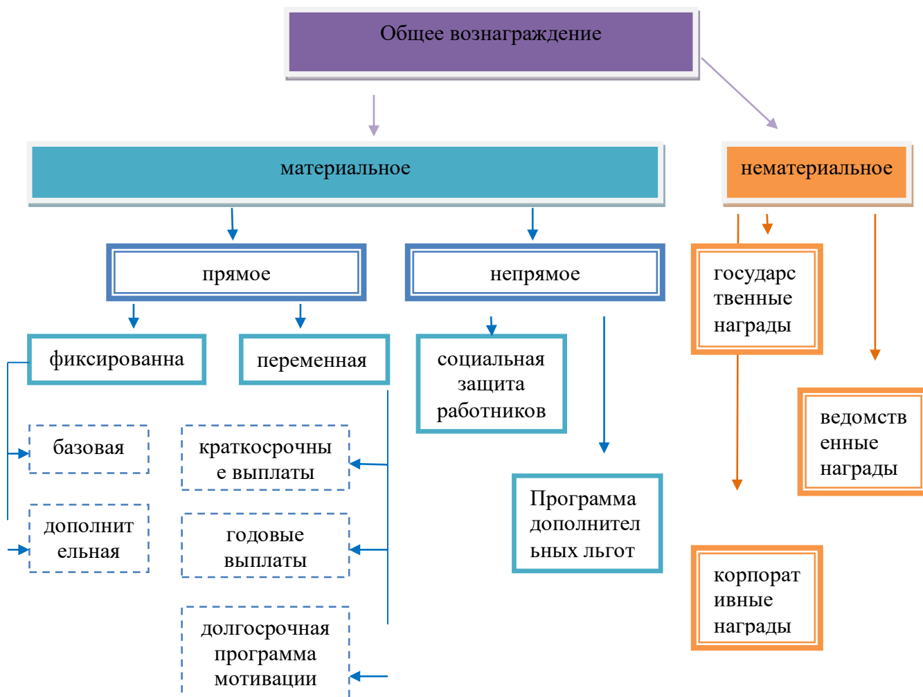
Рисунок 1 – Мотивационная деятельность ПАО «Лукойл»

повышения эффективности его достижений. ПАО «Лукойл» позиционирует свою мотивационную деятельность с точки зрения справедливости вознаграждения каждого работника в зависимости от учета значимости его вклада в общее дело и достигнутых результатов (рисунок 1).