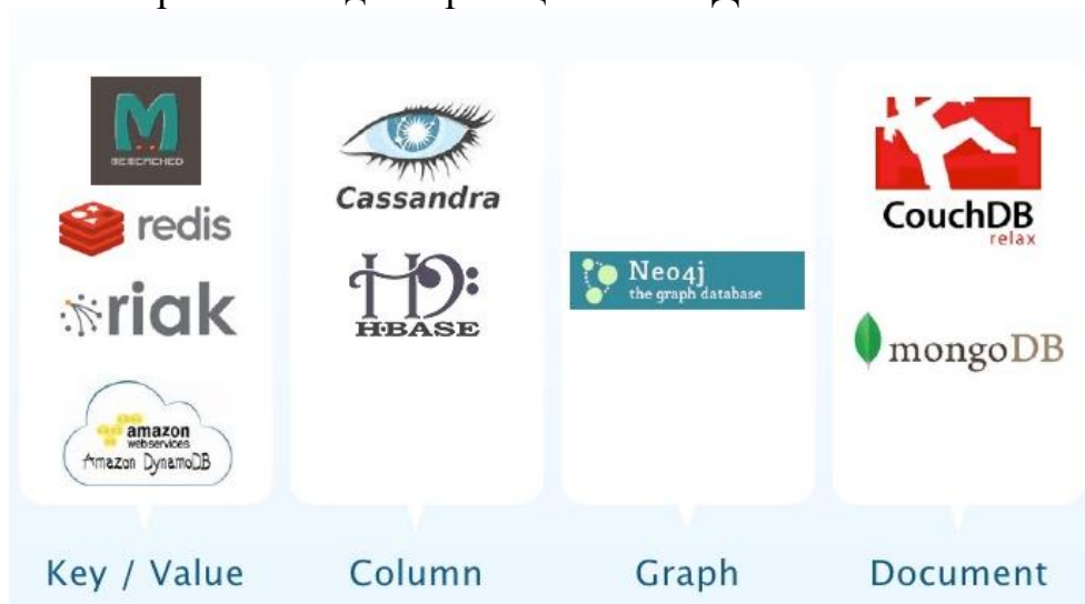
Рис.1 Типы нереляционных БД

На рис.1 изображены виды нереляционной БД.