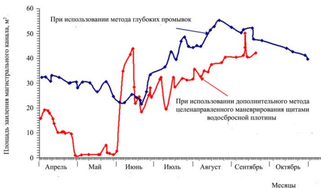
Рис. 2. График сравнения динамики заиления магистрального канала при существующей и новой схеме эксплуатации гидроузла

заиления магистрального канала за пять дней сократился на 20 %. В следующем году с июня по август во время прохождения паводковых расходов от 495 до 579 м 3 /с осуществлялось использование предлагаемого метода в дополнение к глубоким промывкам. Эффективность сочетания методов глубокой гидравлической промывки и дополнительных методов целенаправленного маневрирования щитами водопропускных сооружений плотинного водозаборного узла иллюстрируется данными измерений динамики заиления головного участка магистрального канала (рис. 2).